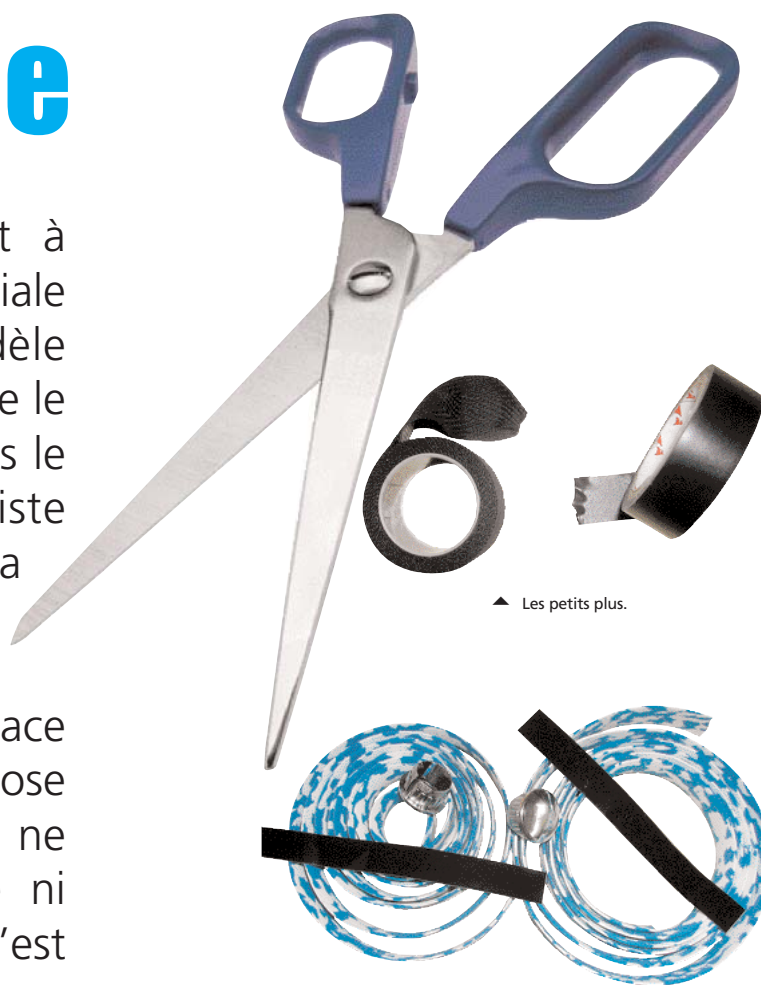
▲ Les petits plus.

La guidoline est vendue sous forme de deux rubans, un pour chaque moitié de guidon. Leur longueur est suffisante, même pour un guidon large. L'emballage contient également deux embouts de guidon - indispensables et obligatoires aux termes du Code de la route, ils peuvent vous éviter de vilaines blessures en cas de chute - ainsi que deux petits bouts de rubans adhésifs. Ces derniers sont destinés à maintenir la guidoline près de la potence après la pose. Ils peuvent être avant-tageusement remplacés par du ruban électrique adhésif et de la couleur de votre choix.