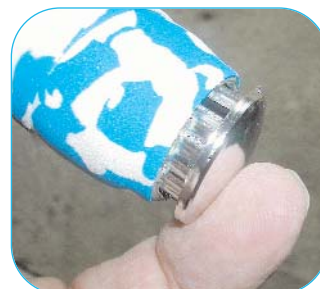
La touche finale. ▶