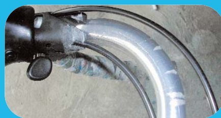
▲ Le maintien des gaines