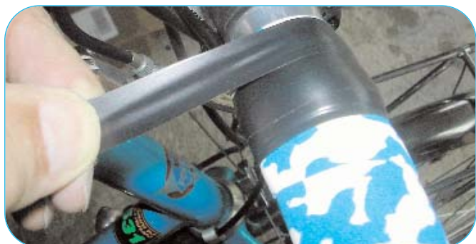
▲ La finition.